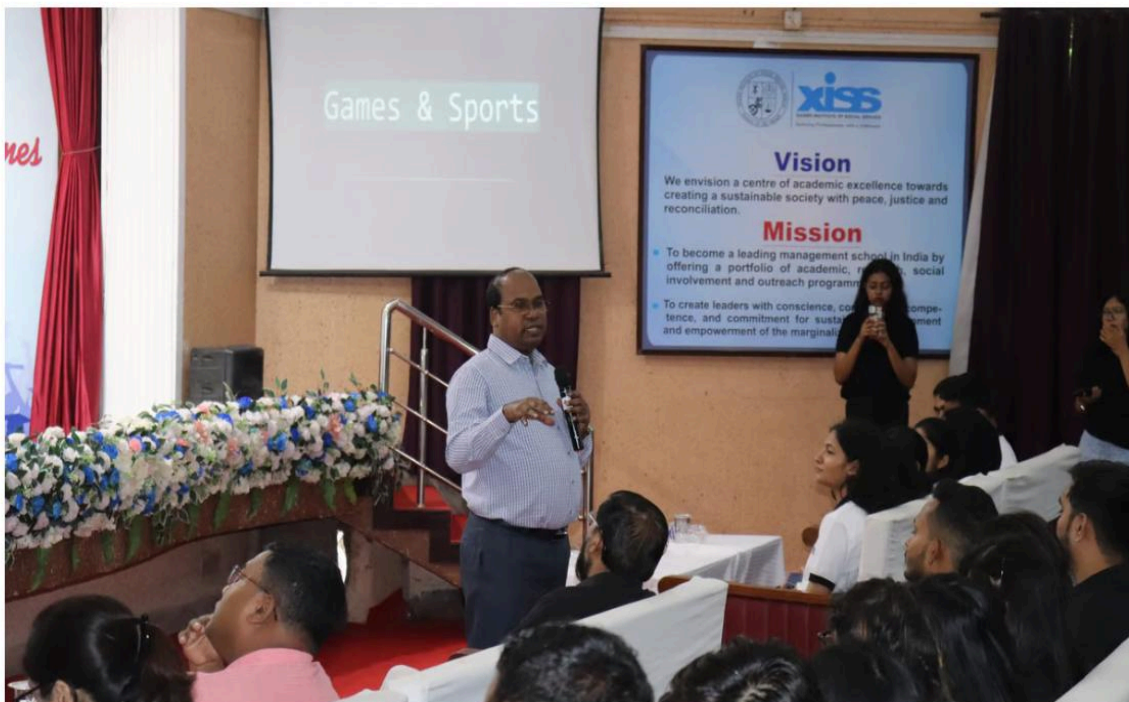
Glimpse from the Orientation-cum-Induction Programme

Concluding the session, all Students' Clubs of XISS were brimming with excitement introduced sports and extra-curricular activities of the clubs